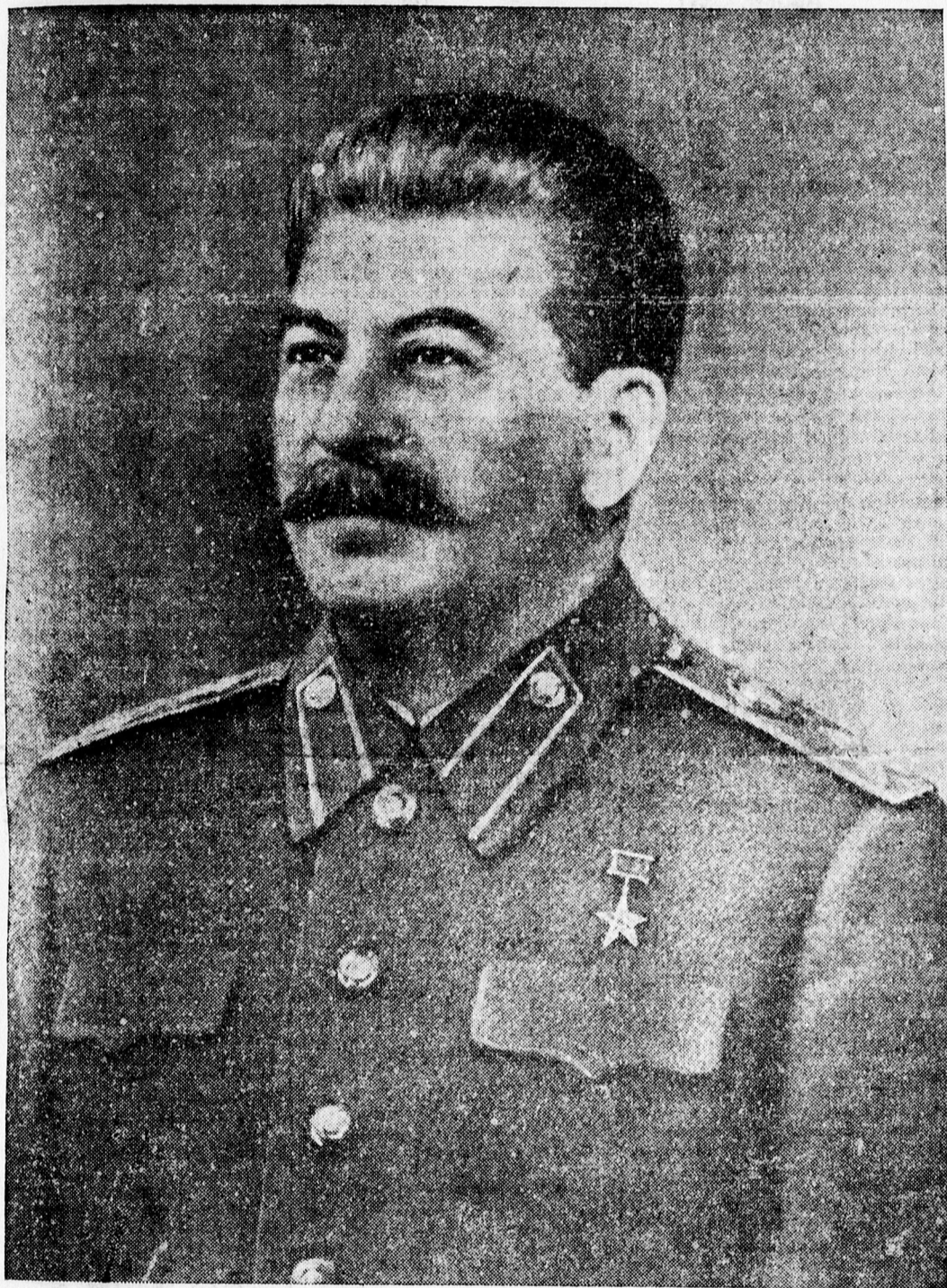
Éljen Sztálin, népünk nagy barátja és tanítója!

Kiadóhivatal: Bajcsy-Zs. utca 1, (Független Kisgazdapárt helyiségénél) félemelet. Telefon: 41-14. Hivatalos órák: reggel 8 órától este 6-ig