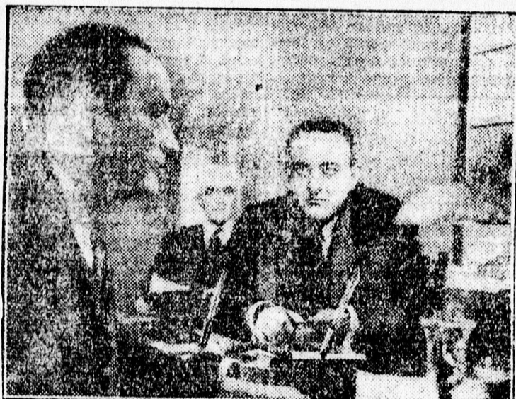
Jelenet a „Titkos megbízatás” című filmből.

Munkája nem volt hiábaváló. Gyementyev önmagát az amerikaiak elhagyott lakóhelyén megtalál egy elrejtett filmtekercset és Mása levelét: „Ez minden,