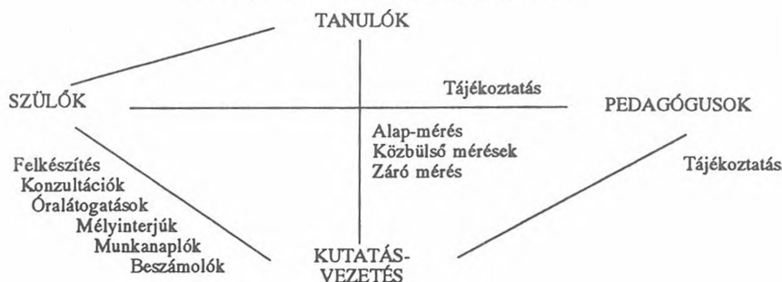
Az oktatási kísérlet tevékenységének vázlata