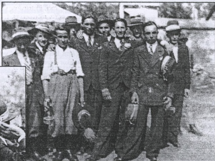
Enesei verbunkot táncoló fiatalok a '40-es években