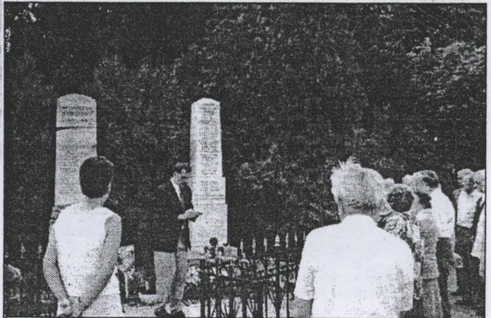
„Hősök napi megemlékezés 2000”

használták. Az udvarban volt kézilabdapálya, kosárlabdapálya, kötélmászó vasállvány, és távolugrásra homokos rész. 1988-ban kezdtek hozzá a jelenlegi új iskolaépület készítéséhez. Az új iskolát a politechnika oktatás számára készített épülethez tervezték. Ez egy tetőtérbeépítéssel két szintes épület, melynek első szintjében már 1989. Szeptembertől megindult a tanítás. A felsős szint elkészítése két évvel későbbre tolódtott. Ebben az épületben 9 tanterem, nevelői és igazgatói, valamint titkári iroda, konyha, folyosók, az alagsorban egy szükség tornaterem és két kazánház található. Az új iskola átadásától mindenütt széntüzelésű központi fűtés működött. Az 1990-es évek elején 20 tanulóra berendezett nyelvi laboratóriumot alakítottak ki.