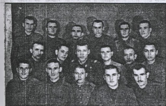
„Kopaszok-kopaszok 1952. XI. 25.” Fénykép a bakaruhában című cikkhez