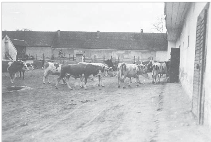
Egykor 100 tehene volt a Korn családnak