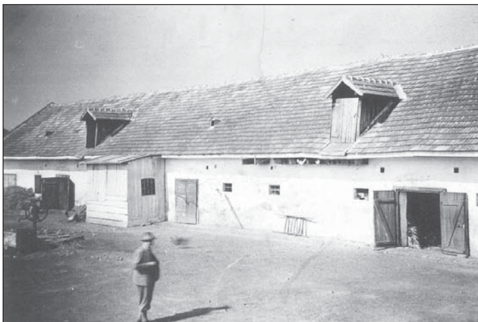
Gazdasági épületek, lebontásra kerültek