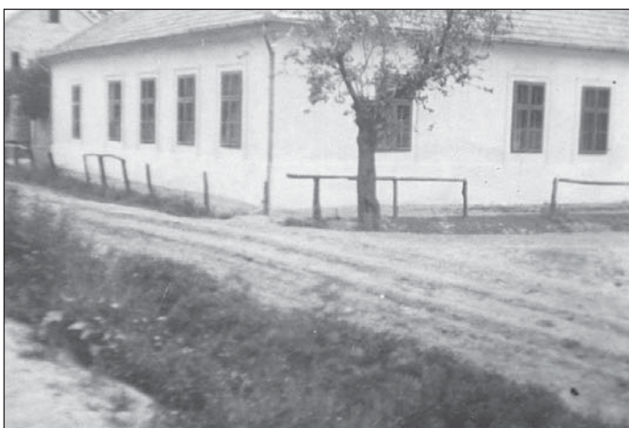
Az épület egy másik felvételen, háttérben a magtár