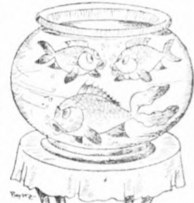
— Mit szólsz Ödön a társberletünkhöz? — Nézd Stelánia, még mindig jobb, mintha egy cethalat utálnak be.