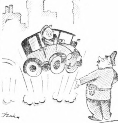
— Meg van örülve? Mit ugrándozik ezzel a taxival? — Nem tebelek róla, biztos úr. Csuklom.