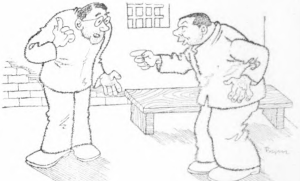
— Miért mondja azt, hogy inkognito van itt? — Mert mindeki azt hiszi, hogy a tengerparton nyaralok.