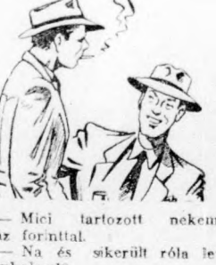
— Mici tartozott nekem száz forinttal. — Na és sikerült róla le gombolnod?