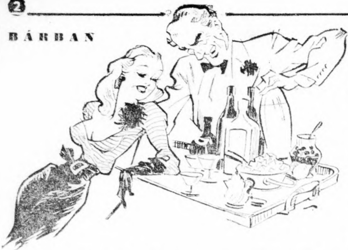
Mondja, Micike, szereti a koktailt? — Akkor keverjünk egyet.