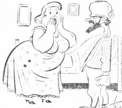
— Meg vagy örülve, Lajos! Mit csináltál? — Hát az előbb mondtad, szíved, hogy ne a nappali pizzámat vegyem most fel, hanem az éjjelit.