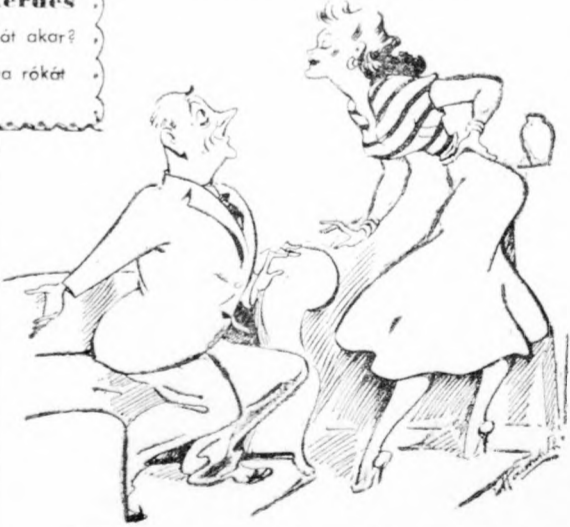
— Lillike, én magának mindent megadok, amit szeme, szája kíván! — És a többiről ki fog gondoskodni?