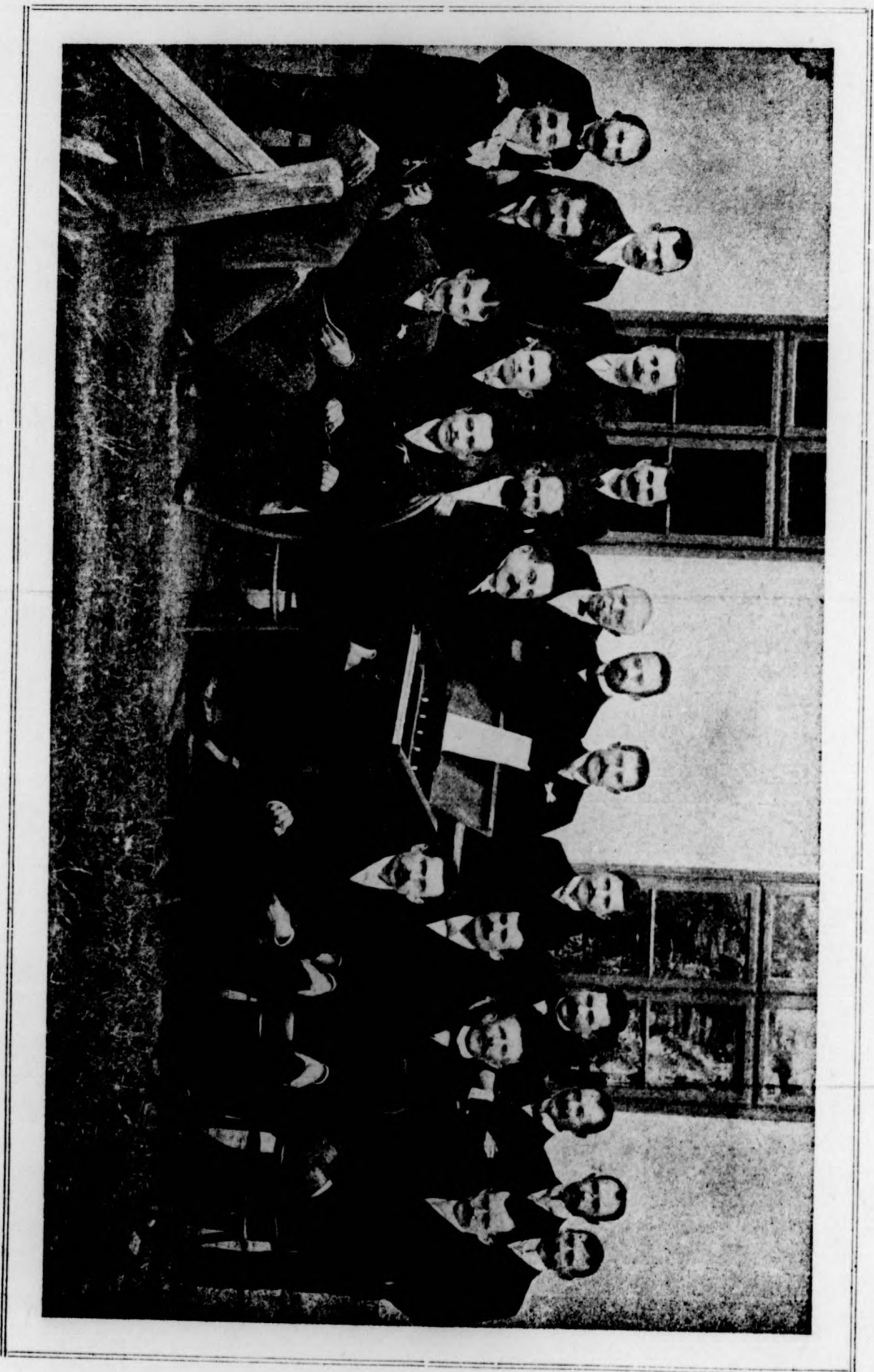
A kisujszállási önálló iparosok dalárdája.