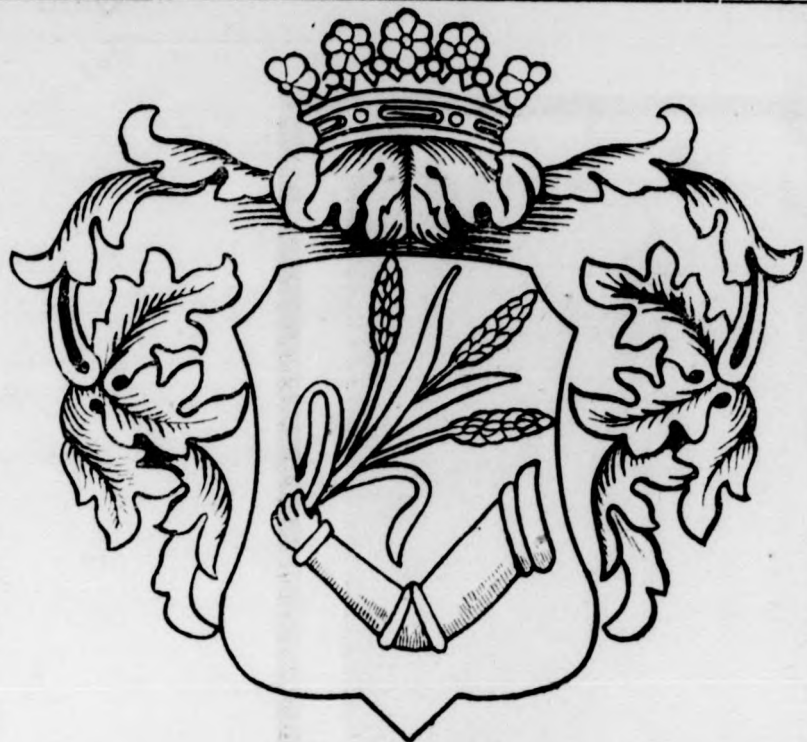
Kisújszállás r. t. város cimere.