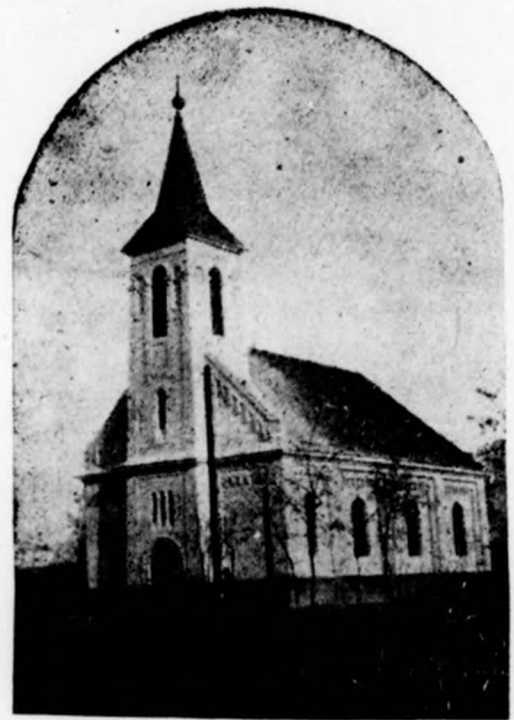
A bucsatelepi új templom.

— mint irtam fentebb: a bűnök elleni küzdelemre is. Egyelőre a káromkodásra. A nemrég megjelent miniszteri rendeletből kifolyólag a buzgó lelkipásztor arra hívta fel az egyháztagokat, hogy az istenkáromlás s rut beszédek ellen vegyék fel a harcot. Férfiak és nők, 60—70 főnyi sereg jelentkezett, hogy az ő szájukat káromkodó beszéd nem fogja elhagyni, s hogy ők szeretetteljes intésekkel másokat is erre igyekeznek bírni. — Azóta nem igen lehet káromló szót hallani Bucsán.