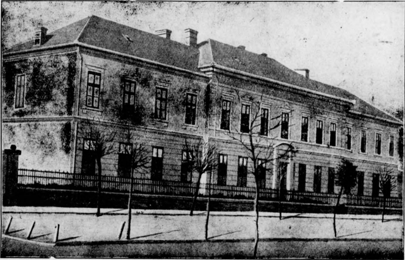
A Leánykálvineum polgári leányiskolája Nyiregyháza.

Lelkészárvák otthonai ama nagyszerű épületek, s más egyéb református gyermekéi, köztük nagyon sok hadiárvái is. Azt mondhatnók, bár hiszen tudjuk és hirdetjük, hogy Isten utáni létrehozója ez épületeknek