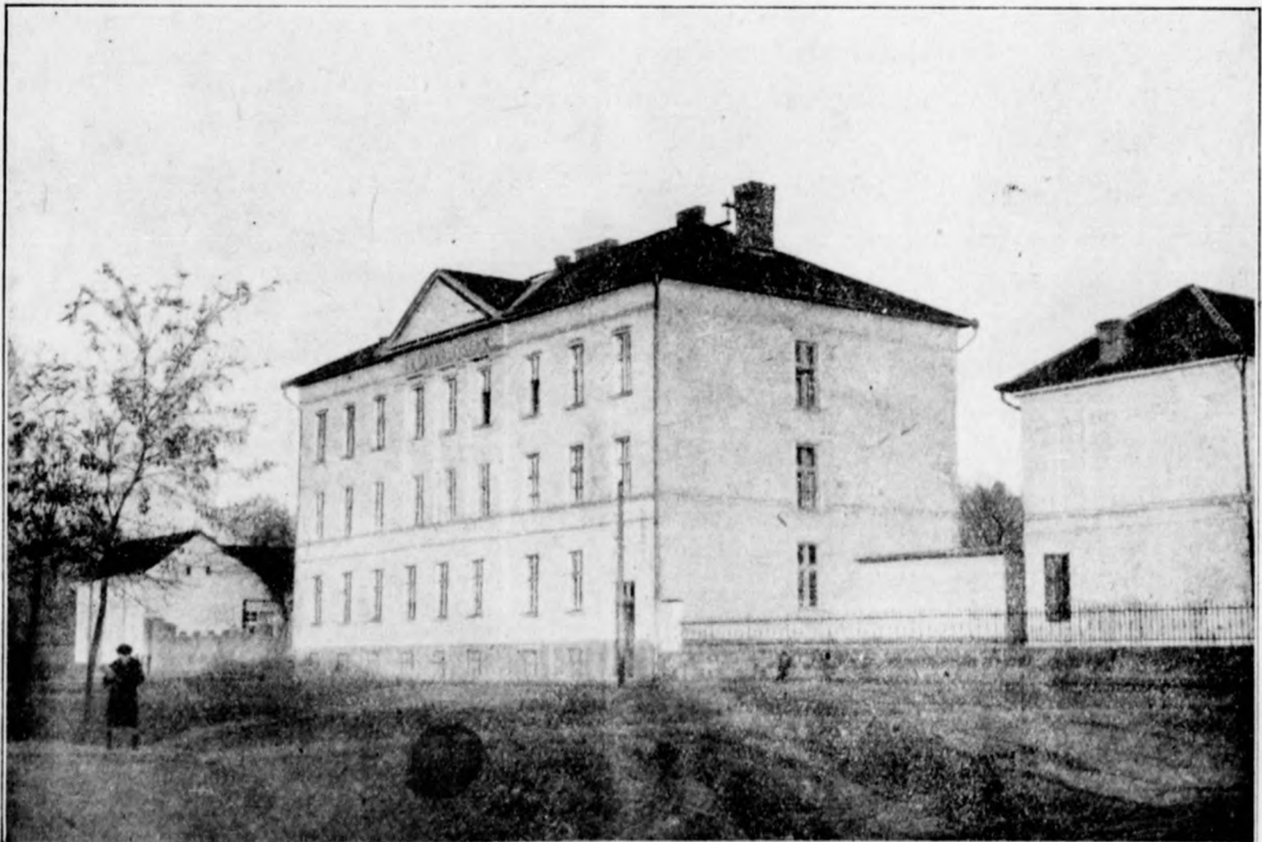
A nyiregyházi Leánykálvineum internátusa.