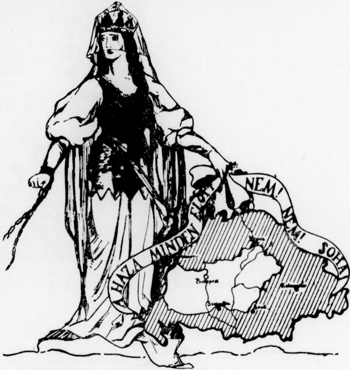
A klivlendi magyar református egyház Évi Jelentésének címlapjáról.

Nagy bátorság kell ehhez, de jól teszik a mi bátor amerikai magyar testvéreink. Egyik ref. egyházunk évi jelentésének címlapján van ez kinyomatva, így mint itt is!