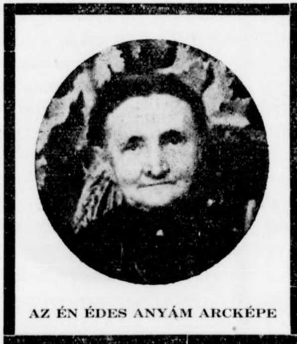
AZ ÉN ÉDES ANYÁM ARCKÉPE