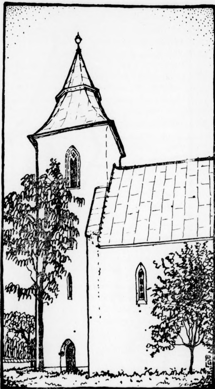
A vizsolyi templom, hol az első magyar bibliát nyomták.

A fordítás, a fordítás alázat. Fordítani annyit tesz mint meghajolni, Fordítani annyit tesz mint kötve lenni, Valaki mást, nagyobbát átkarolva Félig őt vinni, félig vele menni.