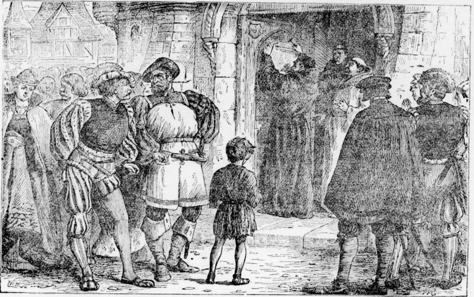
Luther Márton kiszegezi tételeit a wittenbergi vártemplom kapujára.