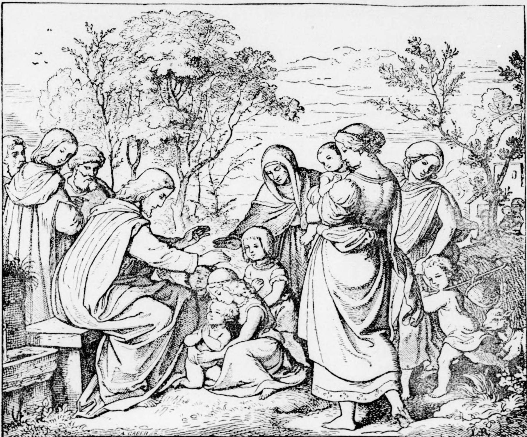
Jézus és a gyermekek.