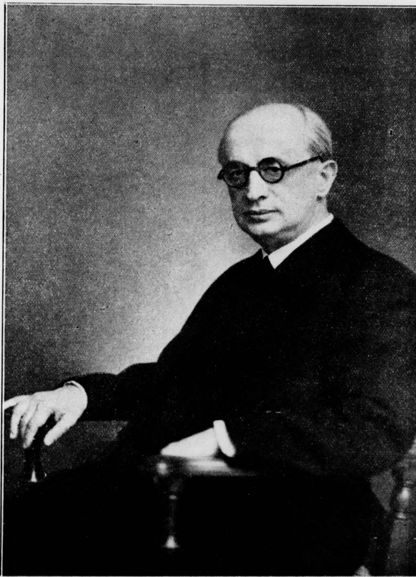
Dr. Ravasz László húszesztendős püspöki jubileumát ünnepelte nov. 20-án egyházkerülete.

Életemet így szenteld meg egészen, Hogy Tenéked tetszhessem csak mindenben. Aldhassalak szívből jövő imával És értelmem minden gondolatával.