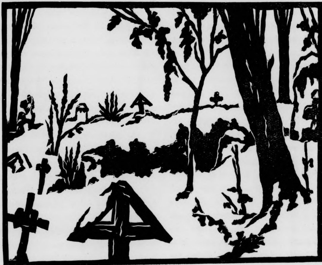
Részlet a kolozsvári temetőből

A Nemzeti Színháznak nem fontos, hogy például 1926-ban volt Mohács négyszázéves évfordulója, jóllehet volt nagyszerű magyar lé-