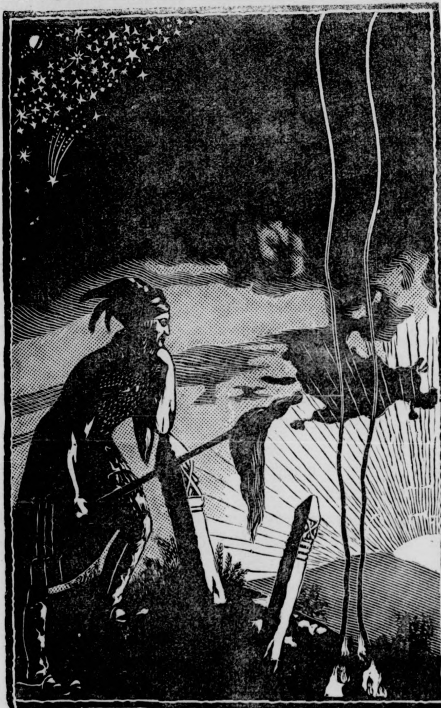
És fölkel a nap.

mindenkié volt, éppen úgy mindenkié, mint ahogy a hit mindenkié volt, az élő, dolgozó, alkotó hit. Nem mese ez, nem fantázia, amit mondok, de komoly valóság. Volt olyan idő: hosszú-hosszu századok.