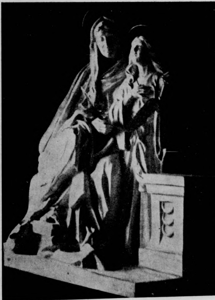
VÁGÓ PÁL GÁBOR: SZT. ANNA ÉS MÁRIA