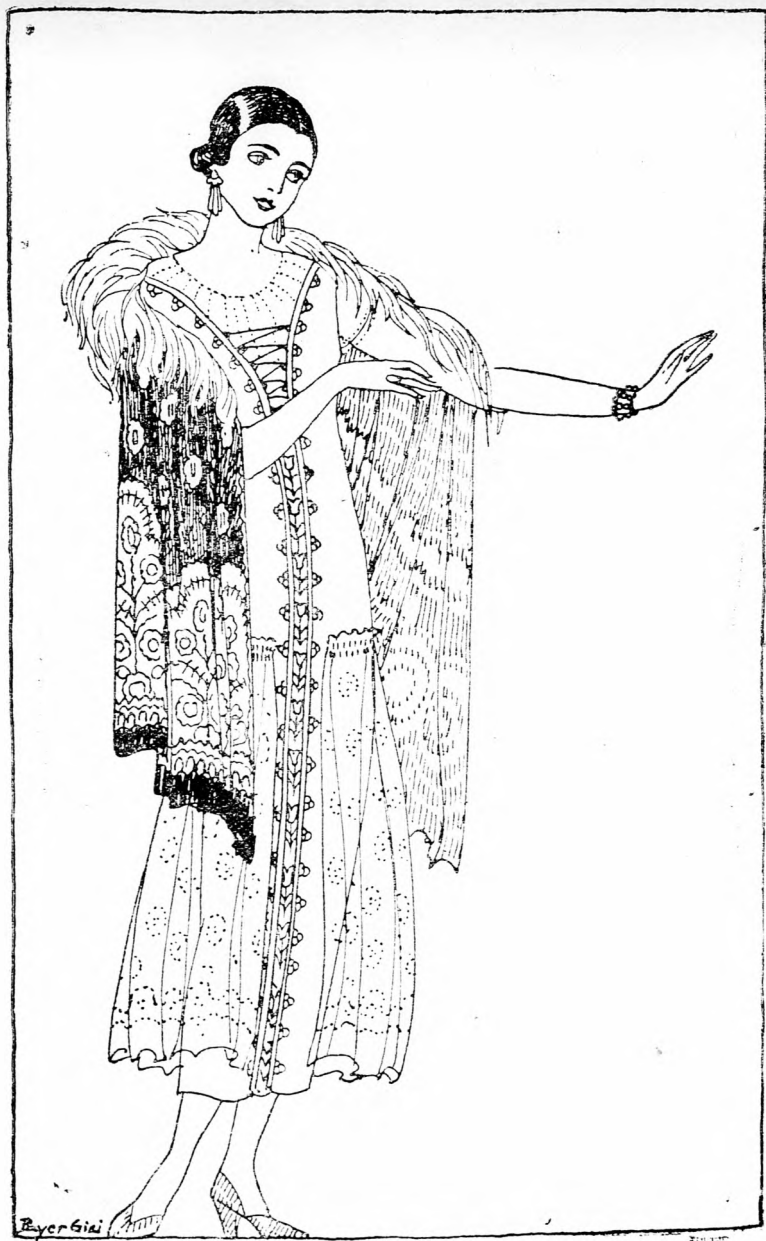
Báli vagy estélyi ruha, arany vagy ezüst csipkedíszsel. A felöltő lenge, puha anyag, batikfestéssel vagy hímzéssel. A nyaknál hosszúszájú strucc tollrojt. Payer Gizi rajza.