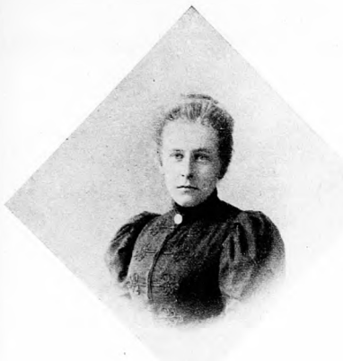
Az élet tavaszán

az ajtó felé. Szerette volna tudni, hogyan szökött meg a madár. Összeszedi a bátorságát. Megkérdi az öregöt. Beszéli fog vele.