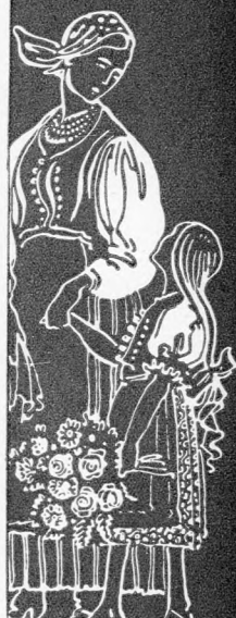
A mátrahégyi «Meseház»