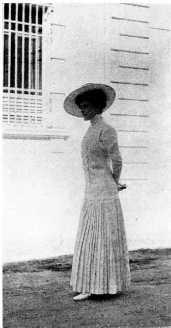
A nemzeti munka kezdetén

Tétován tekint bús szemünk feléd: Isten hozott! — Vágyón sóhajt szívünk: — A «régi háza» hozd vissza — hitünk!