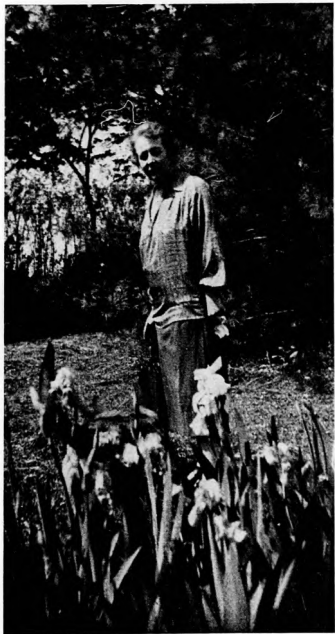
A megpróbáltatások idején 1927