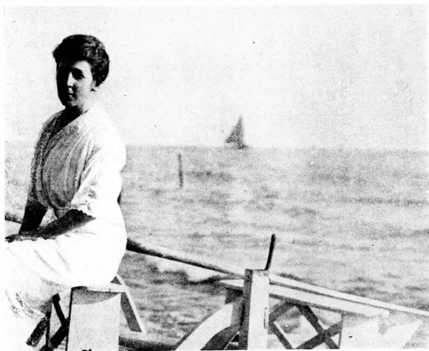
és gondtalanság idejében

Ezentúl gyakran gondolt reá és amit azelőtt sohase tett, munka közben sűrűn pillantgatott