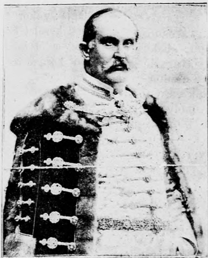
DR. BARABÁS BÉLA, Nagyvárad országgyűlési képviselője.

Előfizetési ára: Ujévig 3 kor. Egy évre 10 kor. Egyes száma 40 fill.