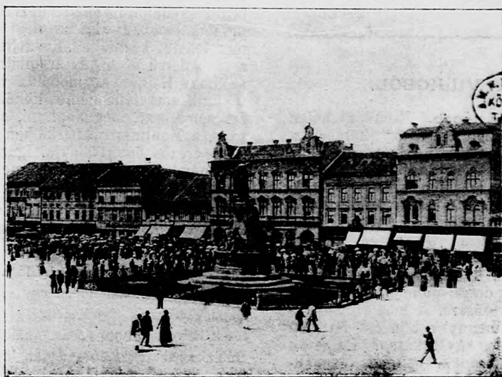
Urnap körmenet a Szabadságtéren.