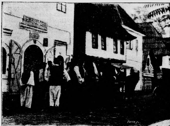
Utezai jelenet Jereroban.

Van pokol, ahonnan a vezeklés Nem nyit rést a léleknek a mennybe : Ahonnan csak vétek szabadit ki Oda, hol a kín is édes-enyhe.