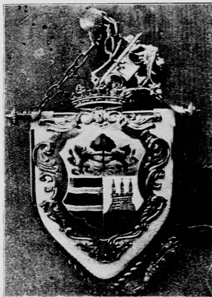
A megyebál táncrendje.

Istenem, ha elgondolom, hogy micsoda fölösleges dolog s micsoda pénz pazarlás egy-egy ilyen táncrend, közgazdasági szempontból — elfut a méreg. Mert tudnia kell, kedves Honisch, hogy a modern asszony manapság a közgazdasági szempontokkal is számot vet és különösen hibáztatja azokat, akik mások kedvéért dobják ki a pénzt az ajtón. Mert ha a megyebál rendezősége még magának csináltatta