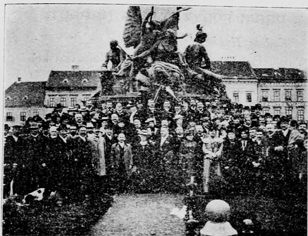
A magyar vasuti és hajózási klub Aradon.