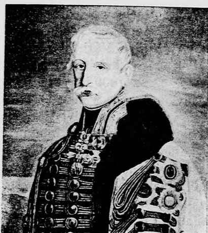
Esterházy Ferdinánd herceg.

de még az előkészületek alatt súlyosan megbetegszik az érdemes immár 80 éves tábornok Belgrád bukását, melynek bevételét még ő készítette elő, bár megérte; de a császár halála, kinek halálos ágya mellett állott; s ki a hadsereghez intézett megható bucsujának közzétételét reá bízta, megtörte az öreg hű katona szívét, ki egy fényes, dicsőséggel megfuttott, hadi tettekben ékes, polgári érényekben gazdag pályája után 84 éves korában 1790. március hó 12 én örökre lehunyta szeméit.