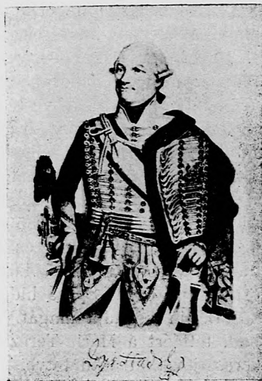
Hadik András gróf ezredtulajdonos.

A 3-ik huszárezred a spanyol örökösödési háborúra való készülődésre 1702-ben I. Lipót császár parancsára lett felállítva. A császár