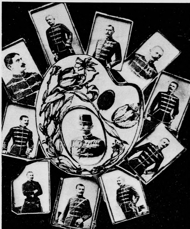
A Hadik-huszárezred jelenlegi századparancsnokai.