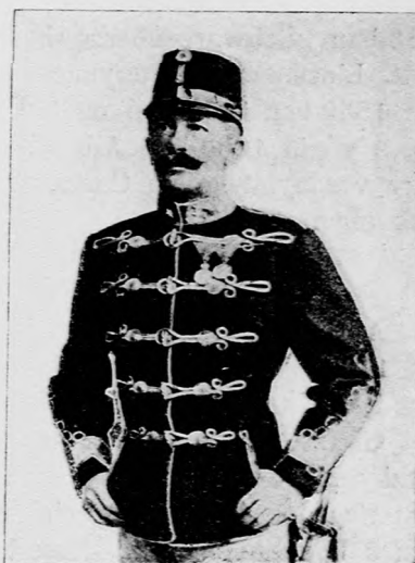
Az „Altold” fényképe.