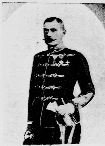
Az „Altold” fényképe.

Az ezred leghíresebb ezredesei között méltán foglal helyet nemes Dévay Pál, ki 1793. március hó 18-án a nervindeeni csatában, midőn vitéz csapataink lőszer hiányában csupán szuronyokkal kezeikben, kétségbeesett s halált megvető bátorsággal vetették magukat az ellenség kartács tüze elé; ezrede élén rohamra fuvatva, reá vetette magát az ellenség tömör soraira, legázolva mindent, a mi elébe került hősi tettével eldöntötte a csata sorsát s biztosította csapatainknak a fényes győzelmet.