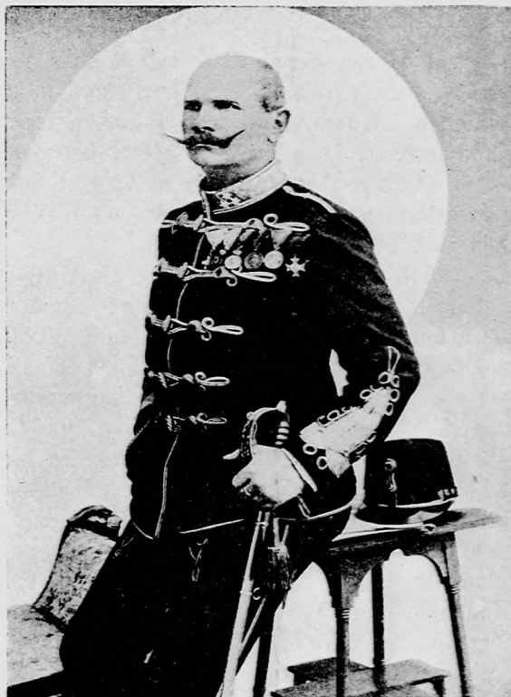
Az „Alföld” fényképe.