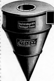
Konigreichs-Patent-Mühle Patentapparat-Drucker Staubsammler CYCLON Patentirt in allen Staaten

Es würde von einer Seite behauptet, dass bisher keiner der Staub-Sammler ohne Filtertuch ein günstiges Resultat erzielt hat, dieser Ausspruch ist nur deshalb zu verzeihen, weil er aus Unkenntniss der thatsächlichen Ergebnisse gethan wurde, die der Cyclone auch in Deutschland bereits geliefert hat und welche nicht das Geringste zu wünschen übrig lassen. Dass der Cyclone bei stark mit Staub beladener Luft noch einen winzigen Theil des feinsten, verflüchtigen Staubes mit der Luft entweichen lässt, soll gar nicht verhehelt werden, weil dieser Umstand den Werth des Cyclone darthun nicht beinträchtigen kann, nachdem der noch entweichende Staub der reine Schmutz und so leicht ist, dass er sich im Freien nicht ablagert und in keiner Weise belästigt. Bei Griesputz-Maschinen aber beispielsweise ist die Wirkung davor, dass die aus dem Cyclone strömende Luft direkt in den Mühlenraum blasen kann, eine Verbesserung, Vereinfachung oder Vervollkommnung des Cyclone in dieser Hinsicht also ganz undenkbar ist und jede Aenderung den praktischen Werth des Apparates nur verringern, nicht aber erhöhen würde.