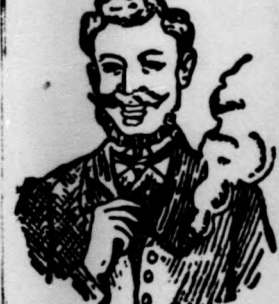
Egger mellpasztillája csakhamar meggyógyított