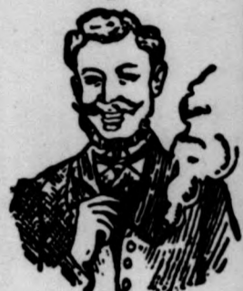
Egger mellpasztillája csakhamar meggyógyított.