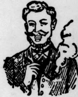
Egger mellpasztillája csakhamar meggyógyított