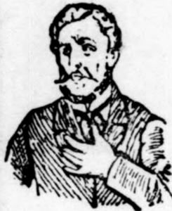
Megfojt ez az átkozott köhögés!