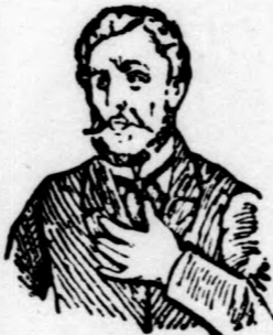
Megfojt ez az átkozott köhögés!