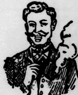
Egger mellpasztillája csakhamar meggyógyított