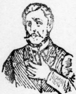
Megfojt ez az átkozott köhögés!