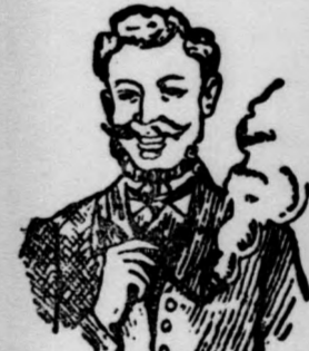
Egger mellpasztillája csakhamar meggyógyított