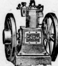
Szilárdan álló motor, 3000-nél több üzemben.

Okleveles gépész felesleges. Óra- és lóerőnként ca 3 fillér. Könnyen kezelhető. Villanyos gyújtással. Olcsóbb a gőzgépnél.