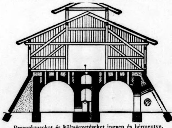
Prospektusokat és költségvetéseket ingyen és bérmentve.

Érdeklődők általunk létesített gyárakat megtekinthetnek.