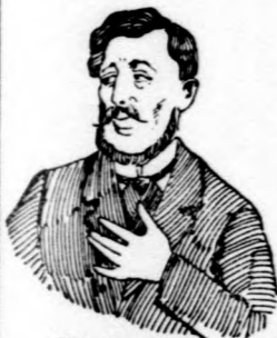
Megfojt ez az átkozott köhögés!

Köhögés, rekedtség és elnyálkásodás ellen gyors és biztos hatásúak