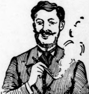
Egger mellpasztillája csakhamar meggyógyított