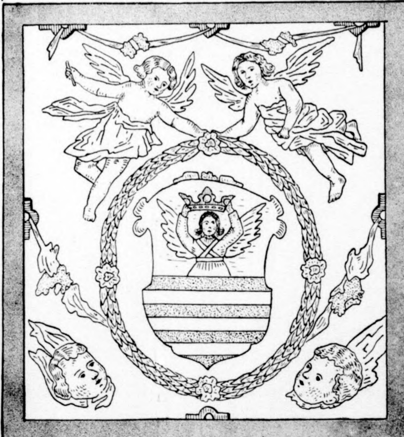
SÁROS VÁRMEGYE CZIMERE AZ 1615. ÉVI EREDETI RAJZ UTÁN.