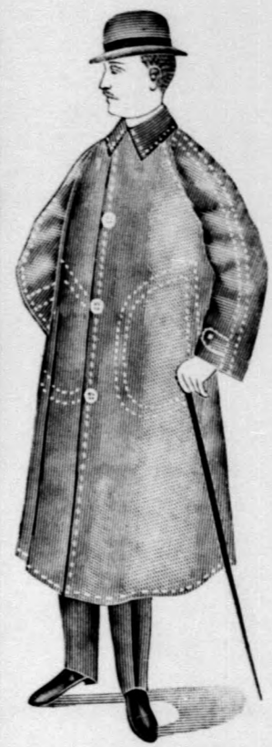
18. szám. Flieger.

== Az eredeti angol == homespun „Flieger” (Schlieter) felöltők :: kizárólag a SPITZER cégénel :: már kaphatók.