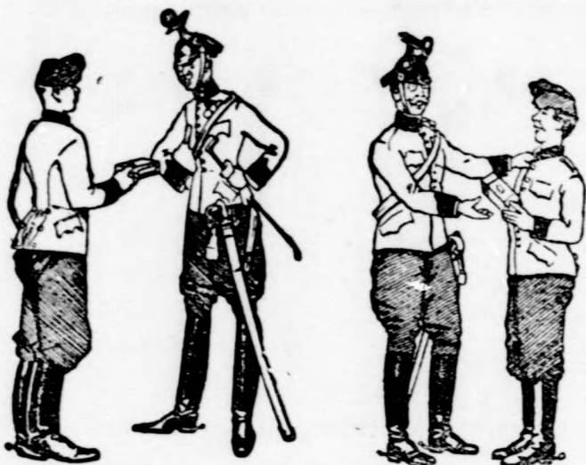
Fickó! Még most sem jögyzted meg megadnak, hogy csak Jacobi antinicotin szivarka-hüvelyt szivok! No lám . . . Ez a valódi Jacobi antinicotin szivarka-hüvely!