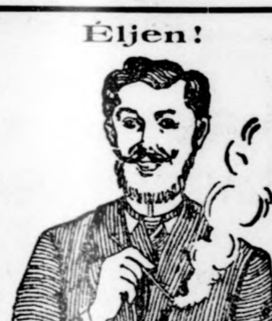
Egger mellpastillája csakhamar meggyógyított