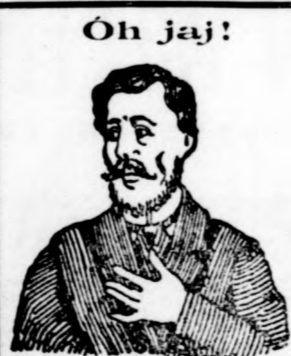
Megfojt ez az átkozott köhögés!