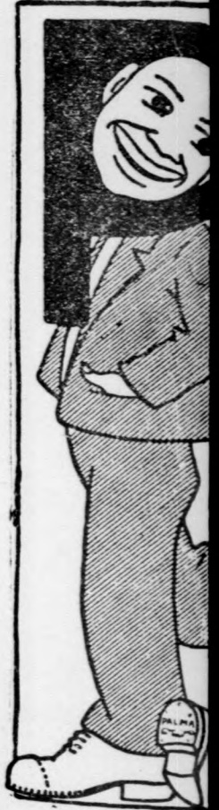
Felelős szerkesztő Dvortsák Győz

Bergmann elérhetetlen ha külsőzetlen s talan elismerő ban, drogériák 80 fillért kap kézápolásra a mely tubusokb