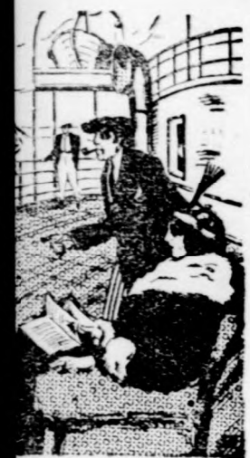
re vetette fényét... adatlanul sivitott és a sétette... Ilyenkor