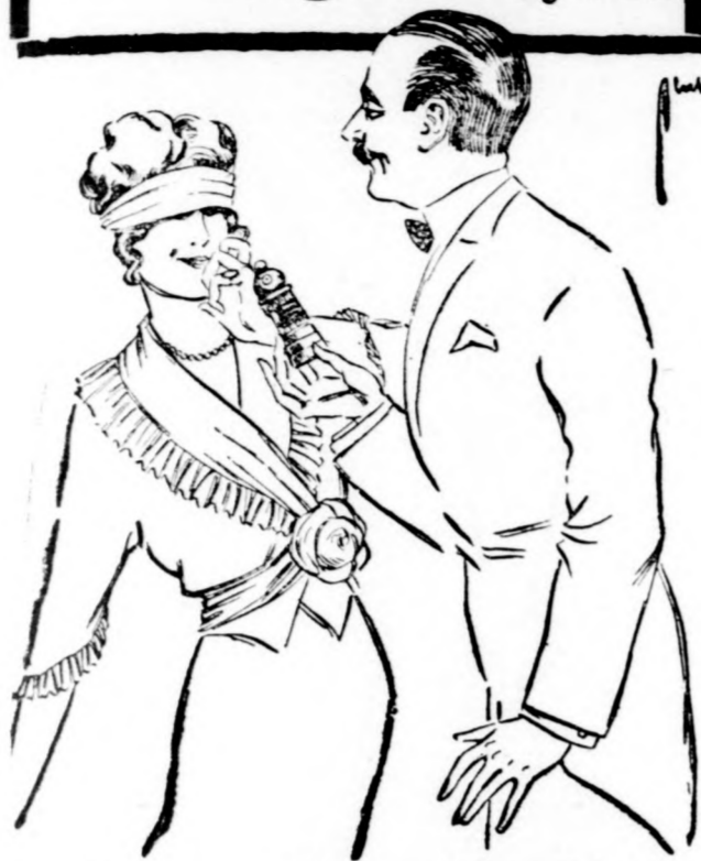
Gyöngyvirág, róza, orgona, heliotrop, rezeda K. 4.—. Ibolya K. 5.—. Minden gyógyszertárban, drogeriában, illatszertárban, szappan- és jobb fodrászüzletben kapható. GEORG DRALLE, BODENBACH a/E.