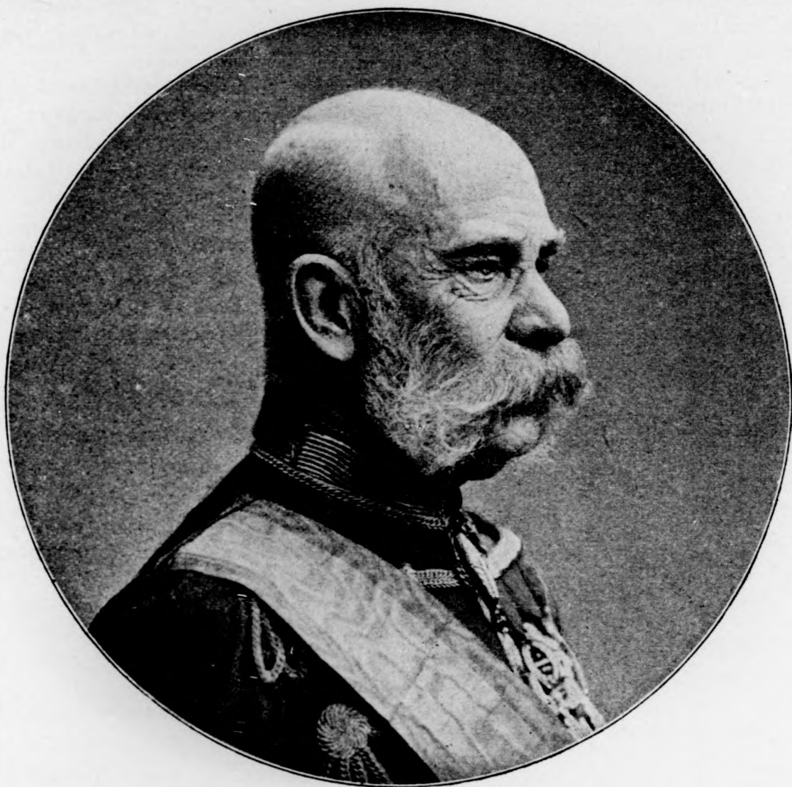
I. Ferenc József.

— Ne tartsanak babonás asszonynak, ha történetemet ugy kezdem, hogy egy éjjel álmodtam.