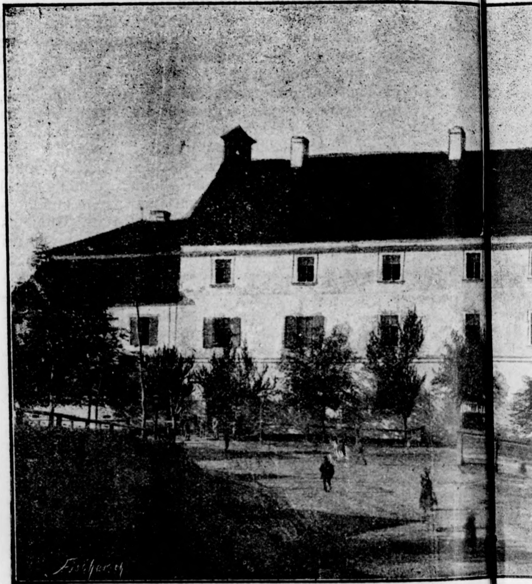
MAROSVÁSÁRHELYI KIRÁLYI KÖZSÉGI KÖNYVTÁR