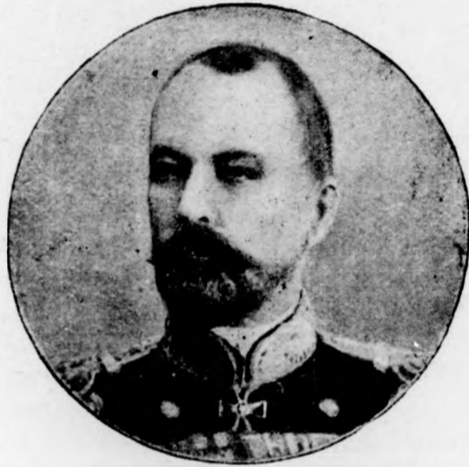
ROSDSTVENSKY orosz tengernagy

De más oka is van a mi hanyatlásunknak. Ki estünk mi is a hitből, az igaz szeretetből, a vallásosságából. Hol van a régi erkölcsök egyszerűsége? Hol van az a boldog megelégedés, amely népünket hajdan jellemezte? Kérdem most, a mikor a drága s nehéz idők járása mellett is folytonosan nő a fényűzés és a kevélység az embe-