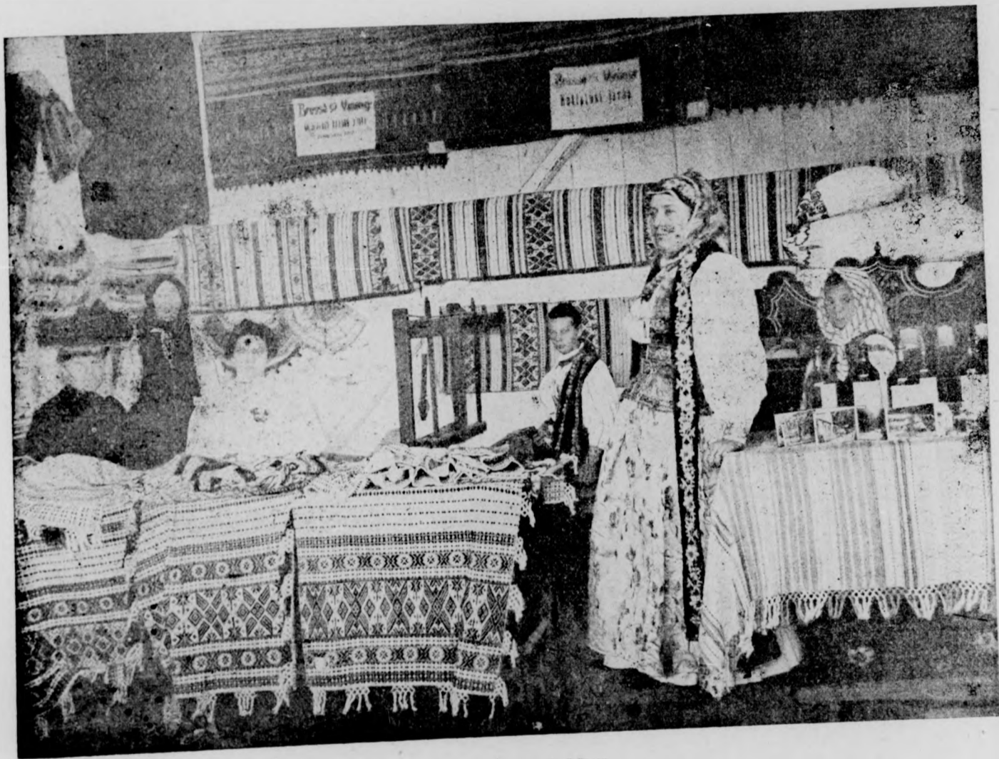
Kalotaszegi varrottas kiállítás.

Várjuk mi is szerényen, alázatosan azt, amit Isten ad. Hiszen a vendég nem parancsol, a bujdosó nem rendelkezik az idegen házában, hanem szerényen meghuzódik és bevárja az események folyását. Itt e földön Isten a házigazda, tehát ő rendelkezik, ő parancsol.