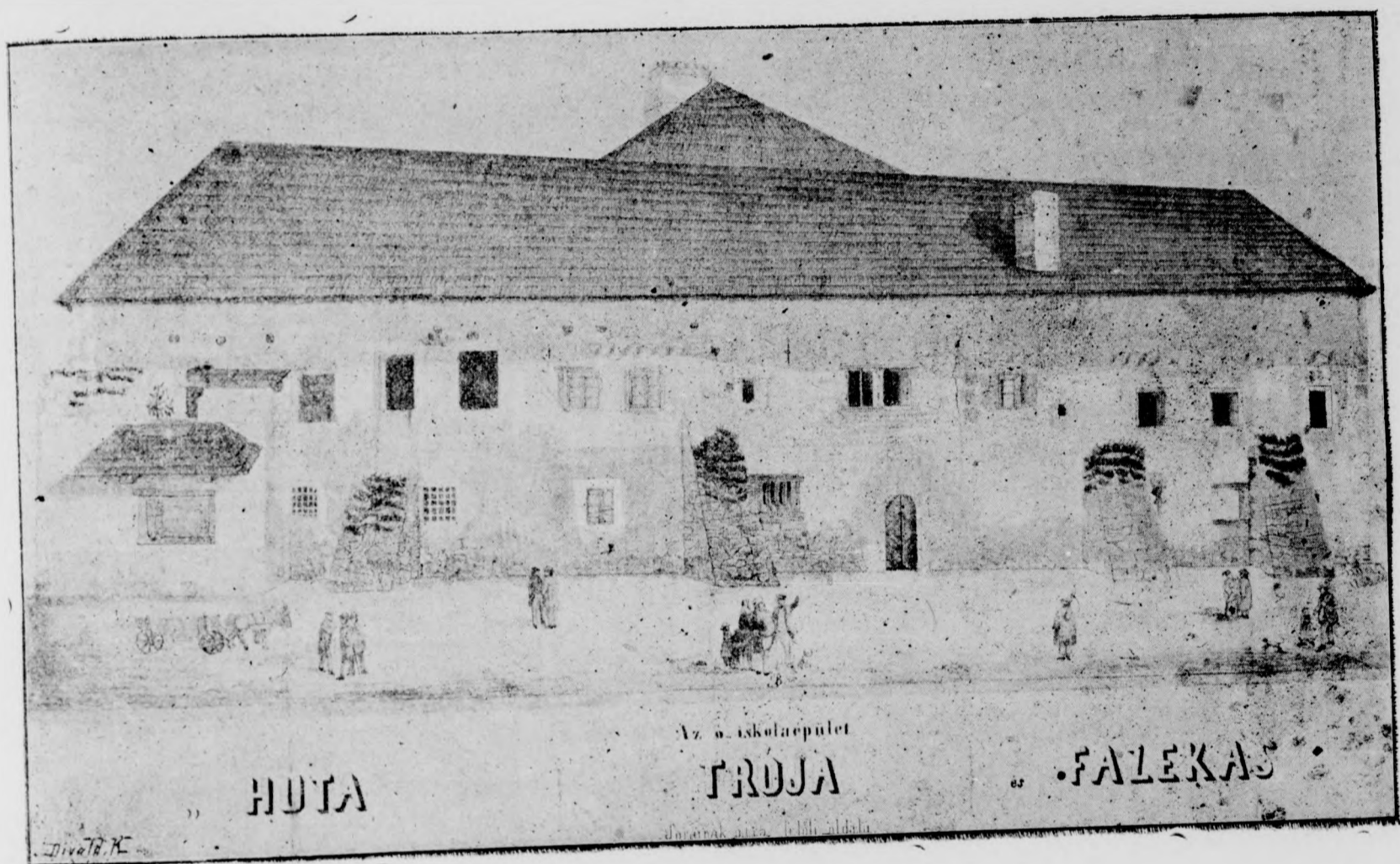
Sárospataki ó kollégium.

Másrészt nem kevésbé veszedelmes és bűnös dolog volna az emberek tetszését, bizonyosságát oly sóvárgással keresni, hogy közömbösek legyünk az Isten bizonyosága iránt. Pedig úgy látom, hogy a veszély különösen ezen az oldalon fenyeget. Nemde, kedves barátaim, az emberek dicsérete és helyeslése a ti életetekben jelentős tényezője a fejlődésnek, vagy visszaesésnek? Mikor tapsolnak, meg vagytok elégedve s mindent elkövettek, hogy tovább is rászorgókat e dicséretre. Ha hizelegve magasztalják kegyességeteket, ti azt egészen helőénvalónak találjátok.