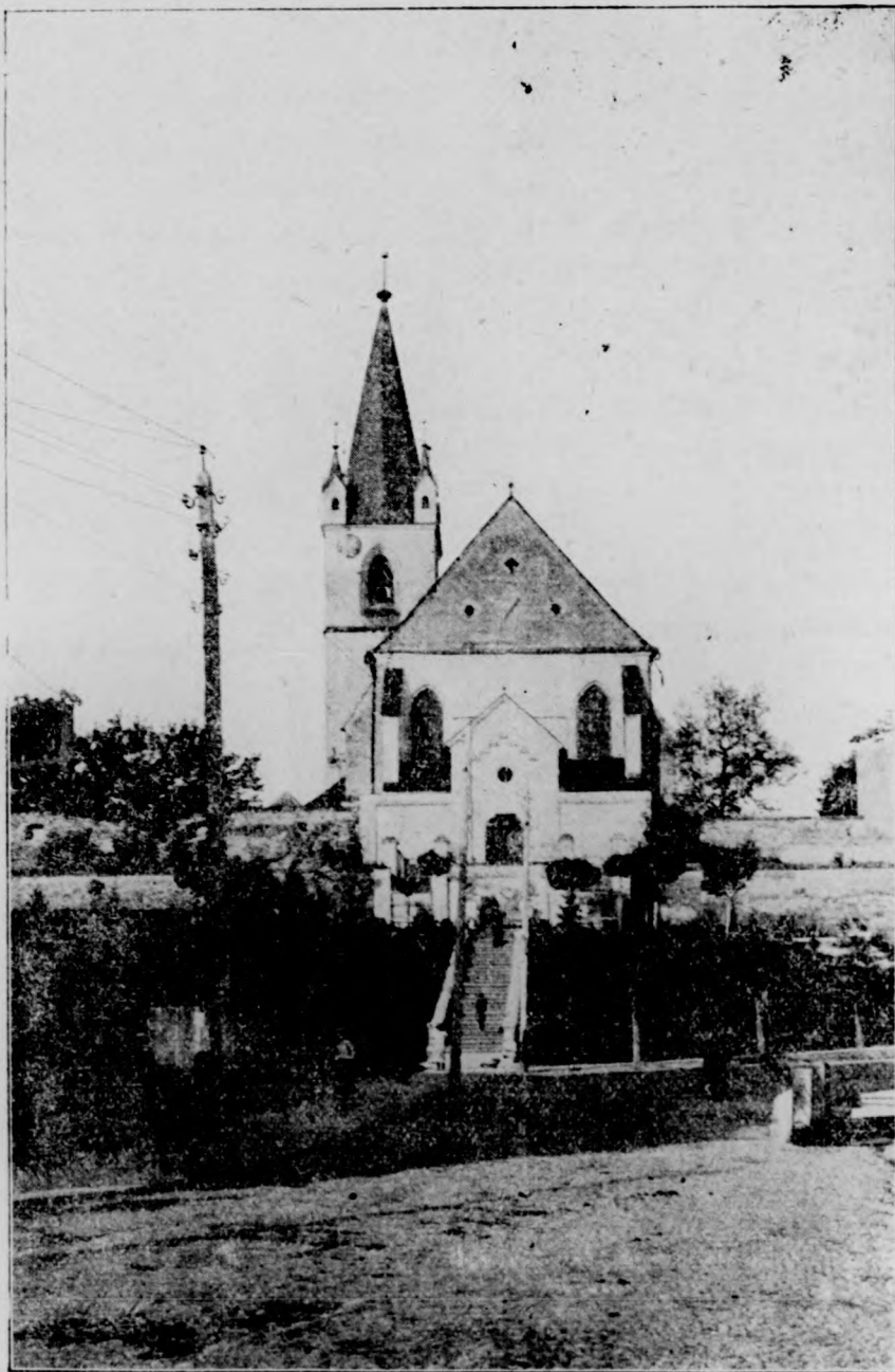
Marosvásárhelyi ref. várbeli templom (nagy templom) legjobb felvétele.

Pálinkamérgezések. Utóbbi időben sok helyen pálinkamérgezések történtek. A hatóságok megindították az eljárást gyártóik ellen. De vajjon mit ér ez. Hány halál kell még ahhoz, hogy e mérget meggátolják munkájában. A múltban itt-ott történt, legutóbb nagyobb számban fordult elő, s talán holnap,