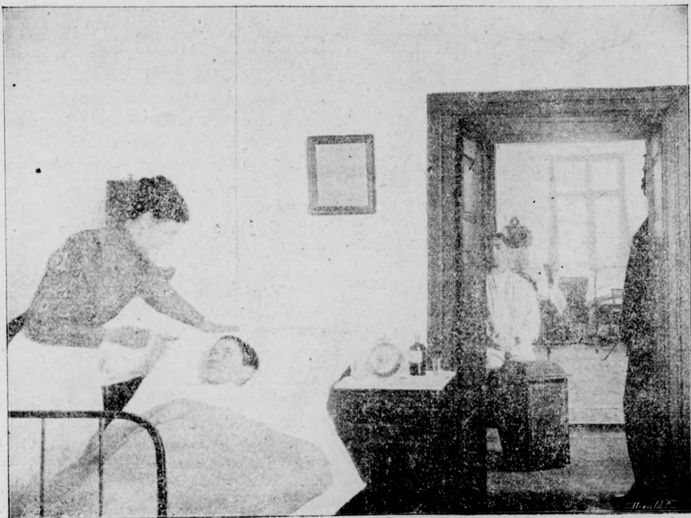
A sárospataki ref. kollegiumi kórház belseje.

Abban a pillanatban, mikor a hölgy hallotta, hogy Isten engesztelő áldozatul küldte Jézust a mi