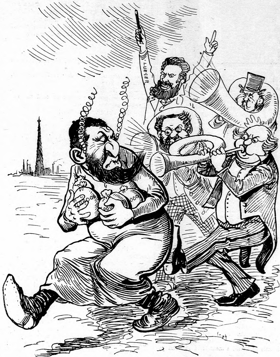
tam pekne vyrecipuju.