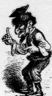
V Lvove echť Poliak.