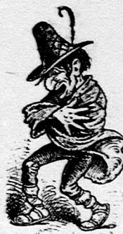
V Trieste národný Talian.