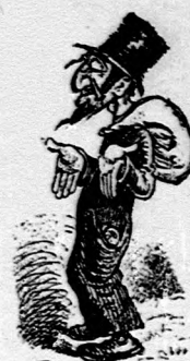
No všade, na nevysťatie Žid.