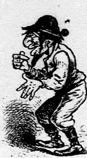
V Prahe opravdový Čech.