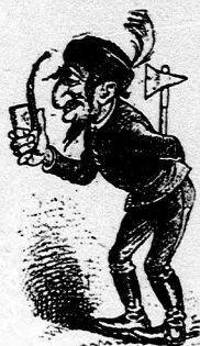
V Uhorsku čistý Madar.