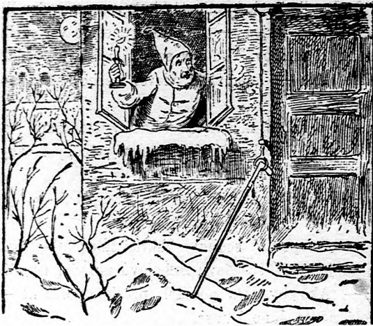
Žartovná hádka v obraze.

Ozaj, kde je ten zbojník? — (Pohľadajte ho.)