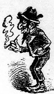
V Austrii oduševnený Rakúšan.