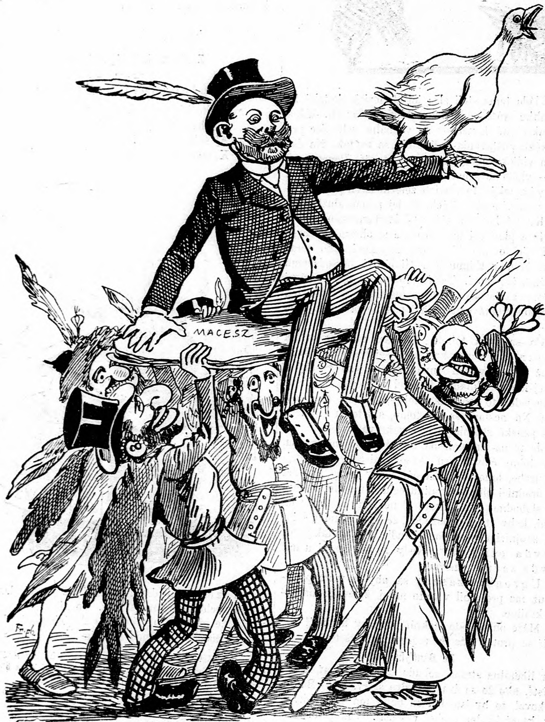
Noví Árpádovia, Bendegúzi! A volia si za vodcu Bánffyho.

182 nob dno toje má via Ján tlet je z na a r farc neč sa Bož spo