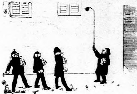
Akých náš pán teraz dostal hostou!