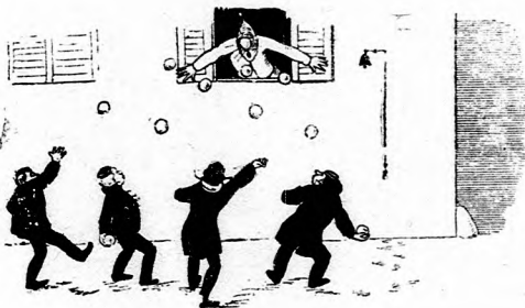
Zvoní zvonec, oblok sa otvorí A už letí celá kopa guli.