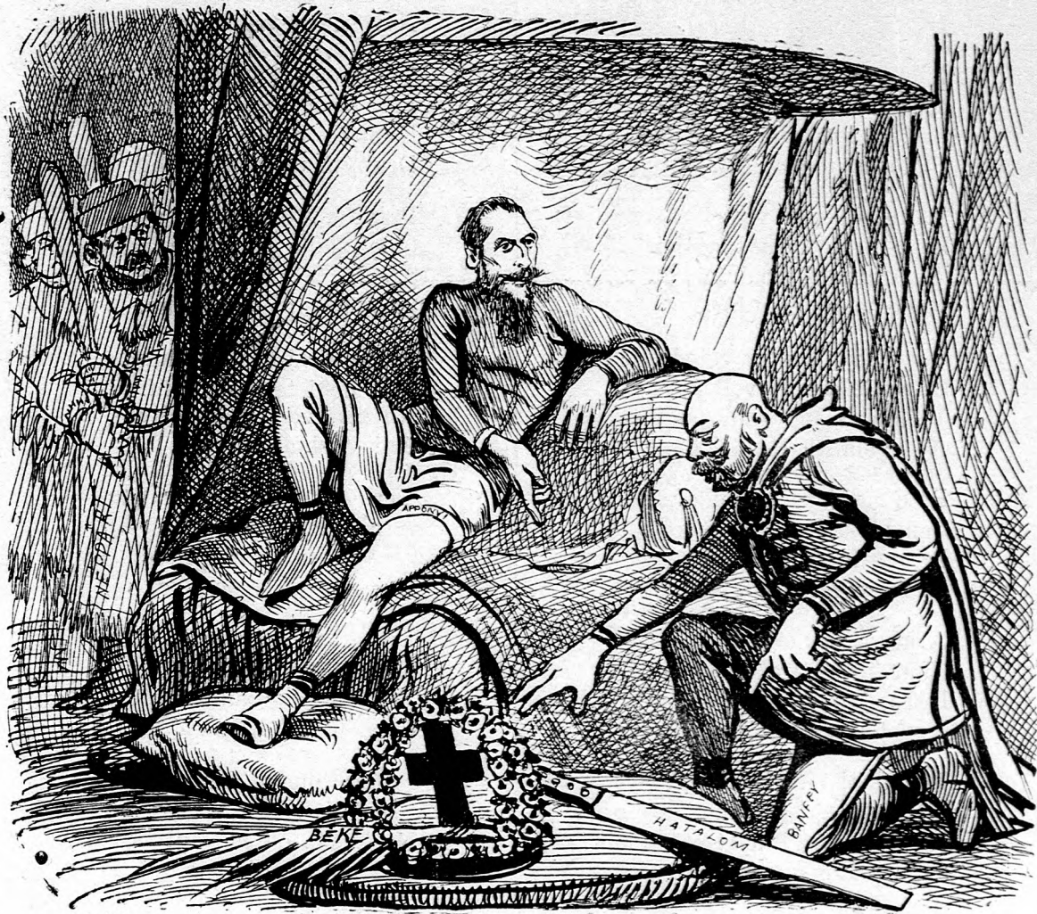
lebo križ, alebo šachterský nôž.