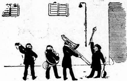
Pod oblokom hraje slávna banda Domáci pán s hnevom ju počúva.