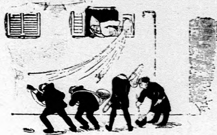
Ze čo spravi, na tom on mudruje. A z obloka pekne ich obleje.