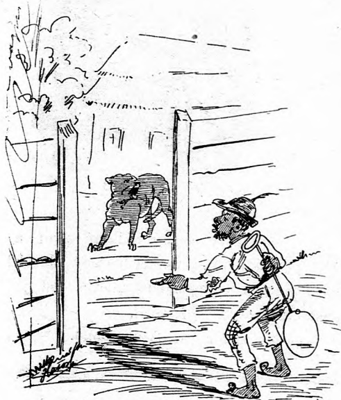
Šinter chce psa zdrapit