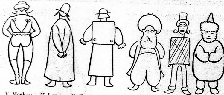
V Moskve V Londíne V Konštantínopoli V Varšave V Budínpešti V Debrecíne.