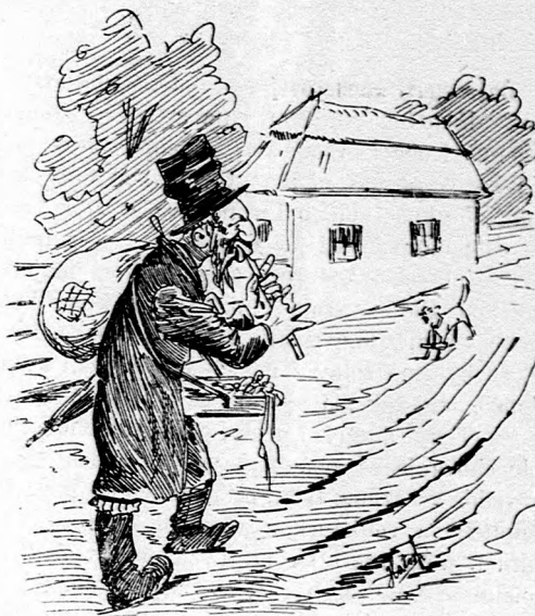
A tento pán ľudí klamať.